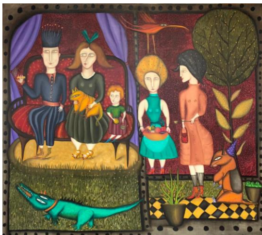
Familia militar en el cinematógrafo, 1997

Estas obras han sido pintadas por María José Romero.