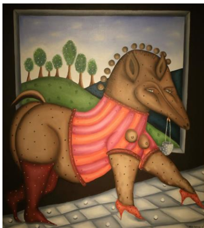
Caballo con bolsa I, 1987